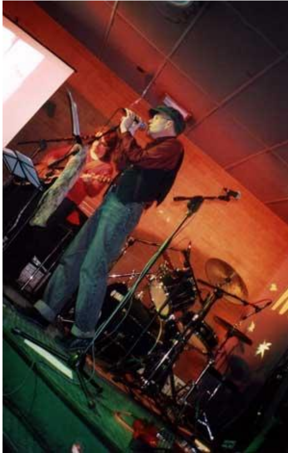
TAN FIERO TAN FRÁGIL. 2003