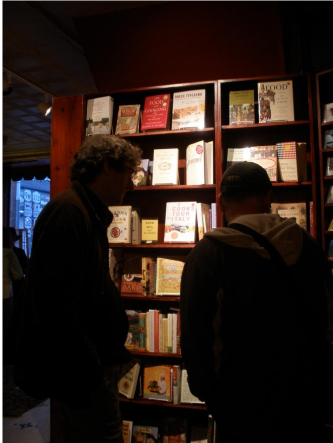
NUEVAS LETRAS INÉDITAS Y POEMAS MUSICADOS (2010-2013)