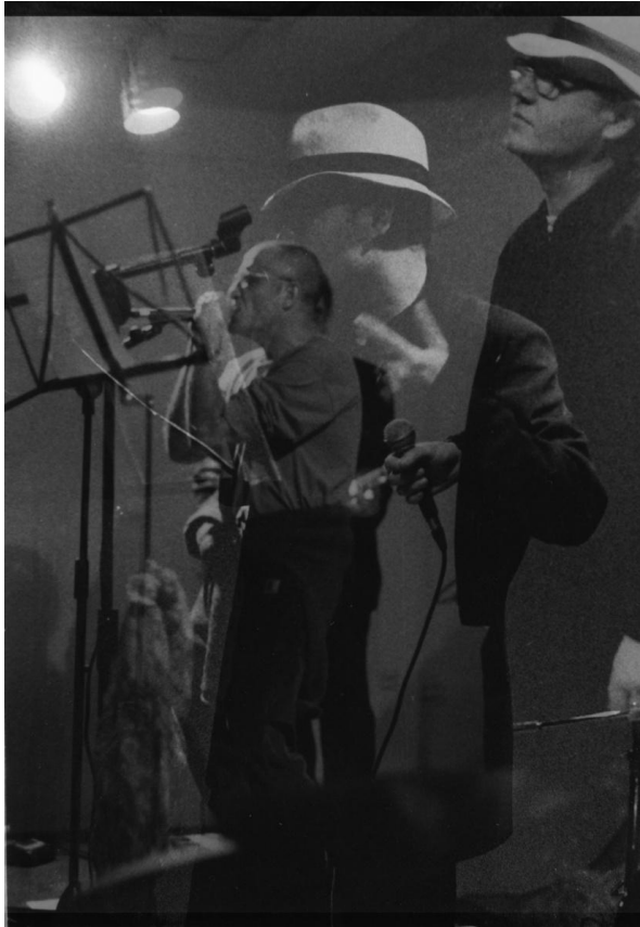
VASH GON (2000)